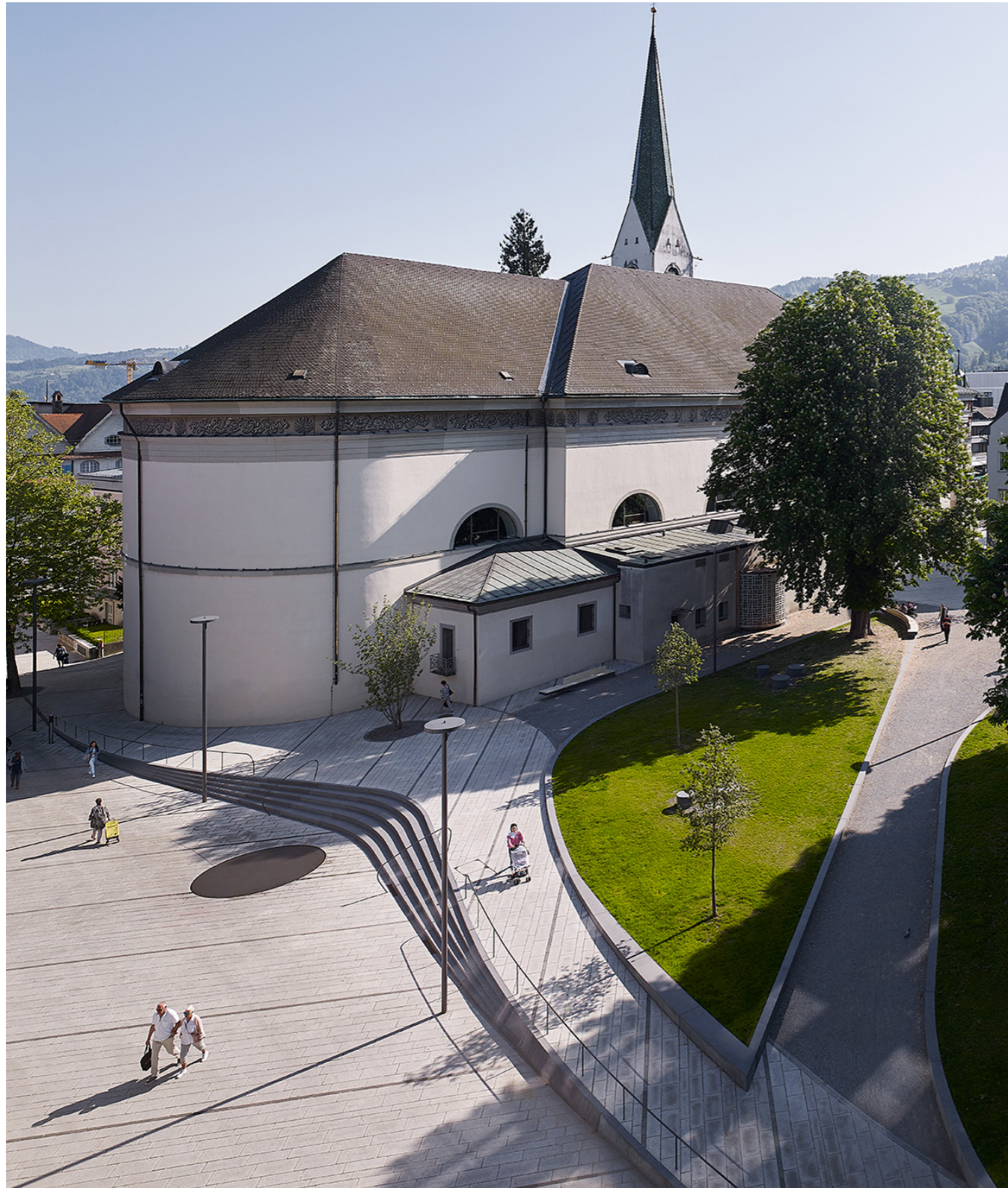
LAAC DWI PEX MLP 11V HR

„Die Freiraumgestaltung „Stadtnaht Dornbirn“ nützt das urbane Potential einer topographischen Gegebenheit und verwandelt eine Stadtkante in eine räumliche Stadtnaht.“