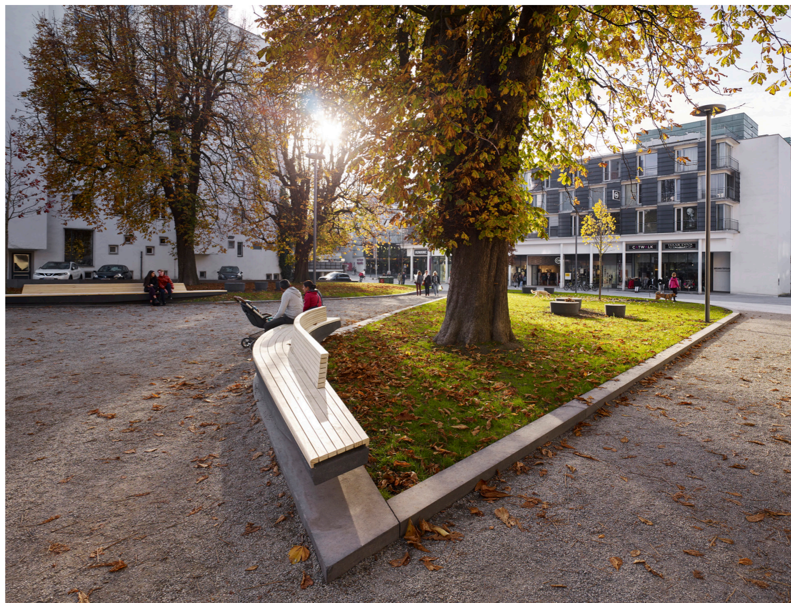
LAAC DWI PEX MLP 02 HR