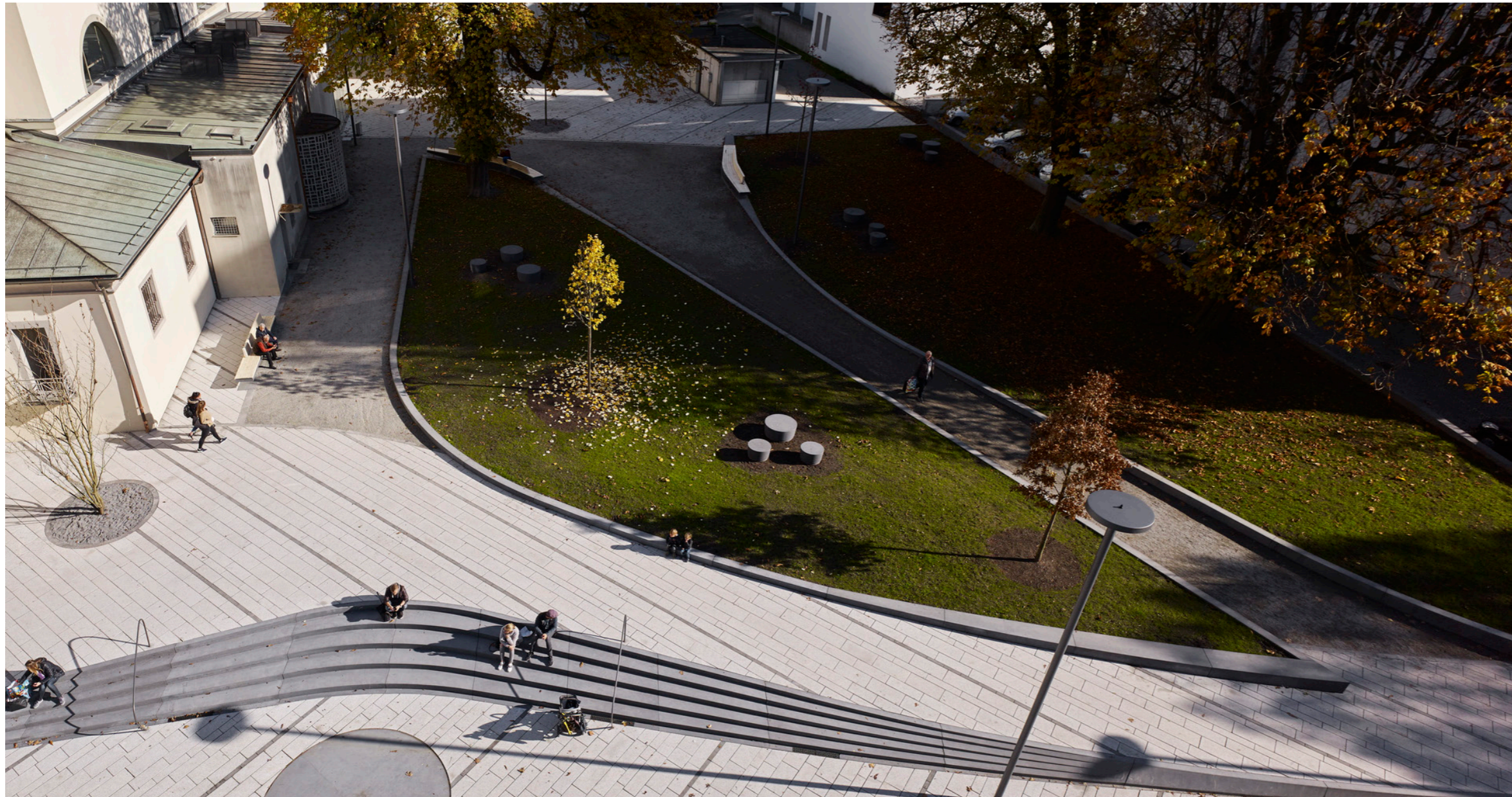
LAAC DWI PEX MLP 05 HR