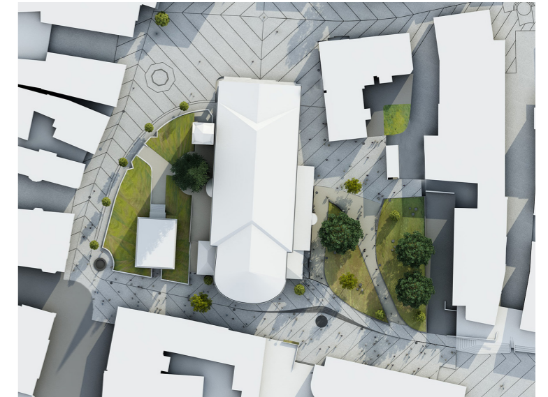
LAAC DWI VIS 009 HR

Die Grünanlage im Kirchpark ist als erhöhte Landschaft konzipiert. Sie verschafft einen Überblick über die Parkanlage und differenziert den Platz hinsichtlich seiner Anforderungen und Wegeführung. Die diagonale Achse, sowie die bestehenden un-