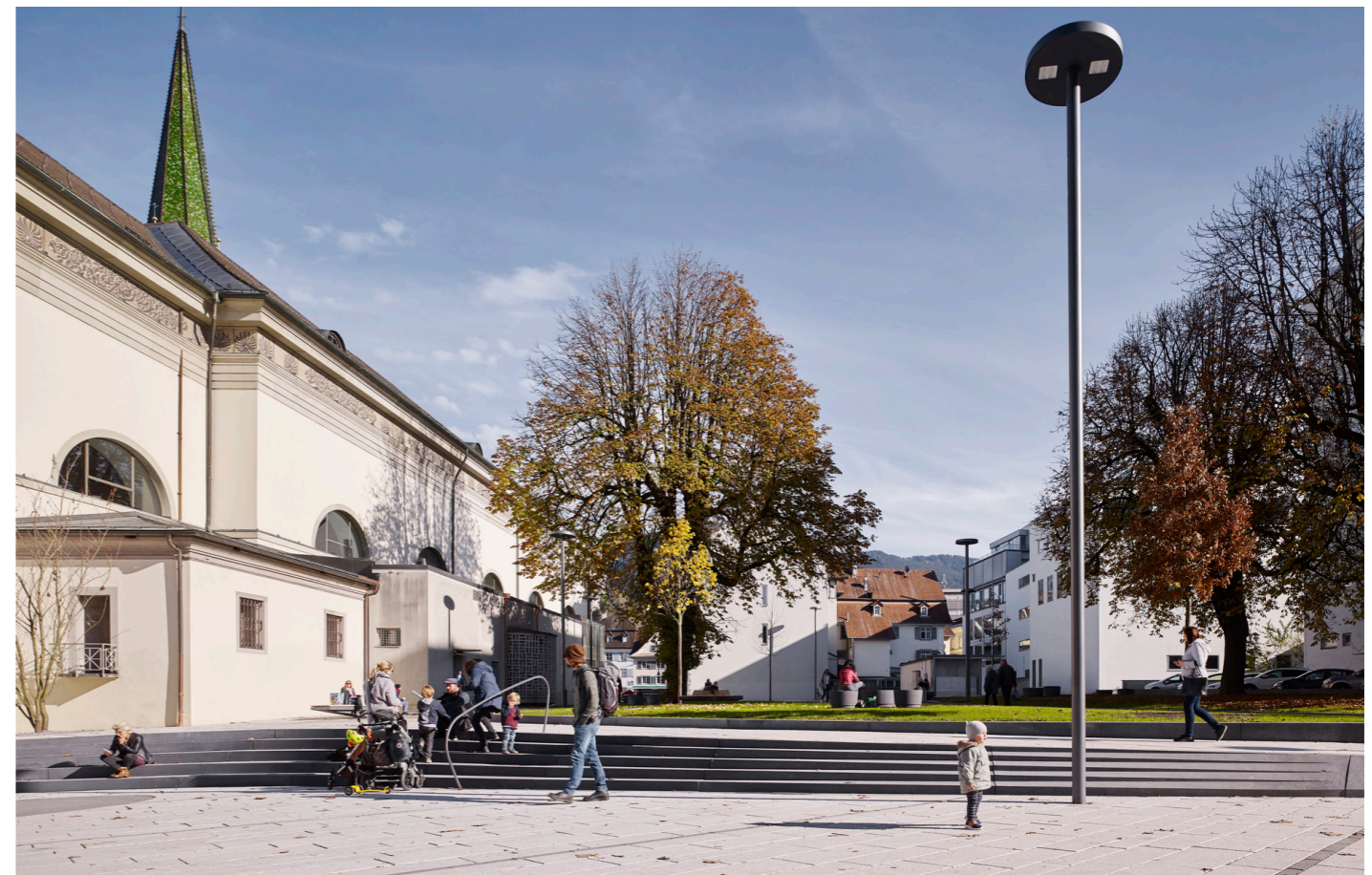
LAAC DWI PEX MLP 06 HR