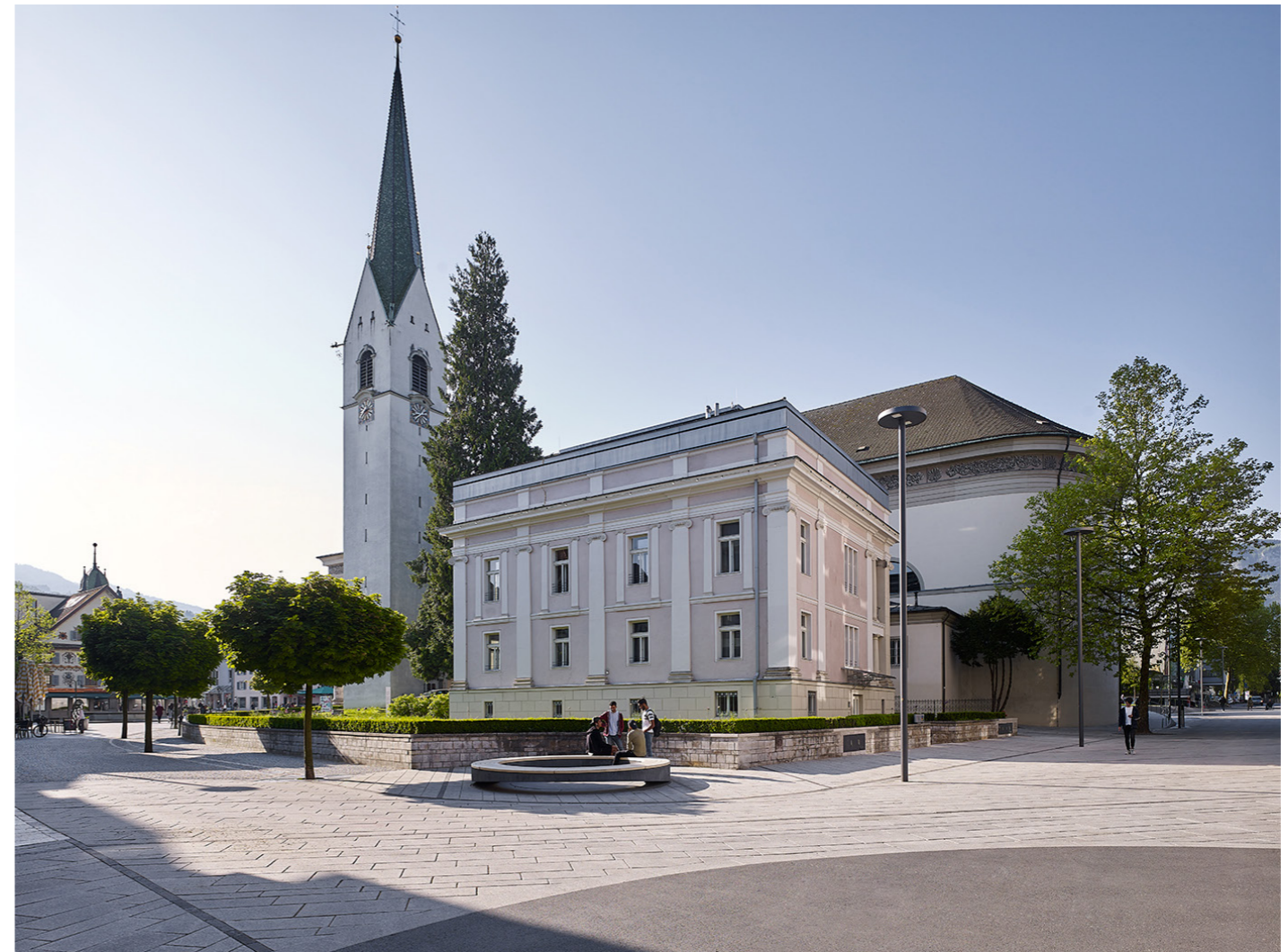
LAAC DWI PEX MLP 10 HR

The overall project for the enhancement of central Dornbirn is being carried out in a series of construction phases. The completed first phase has been very well received by the public and, hence, is already doing justice to its promised role as a popular, lively central district.